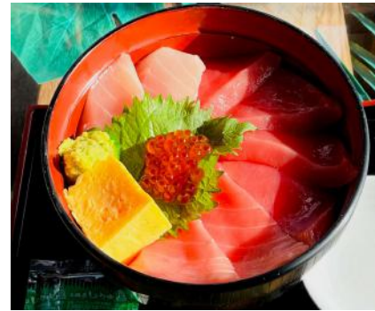
F-② 特選丼A 赤身・中トロ・ピンチョウ・ いくら・厚焼き玉子 2,500円 (税込)