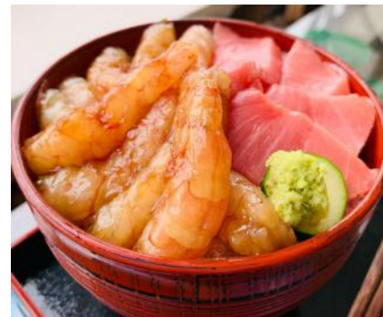
F-④ 特選エビトロ丼 赤エビ・中トロ 4,300円 (税込)